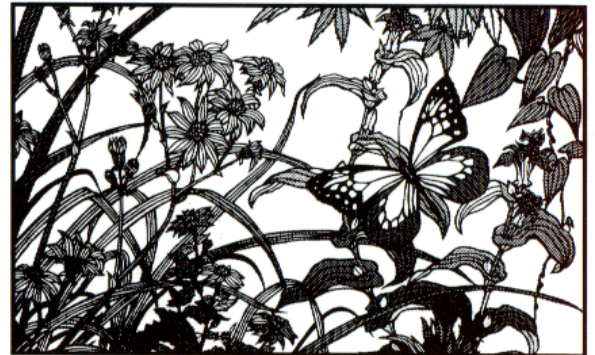
秋 叢 1992年11月