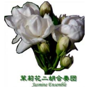
茉莉花二胡合奏団 Jasmine Ensemble

我愛北京天安門 賽馬 奔馳在千里草原 光明行 翼をください 茉莉花 荒城の月 故郷 草原の太陽